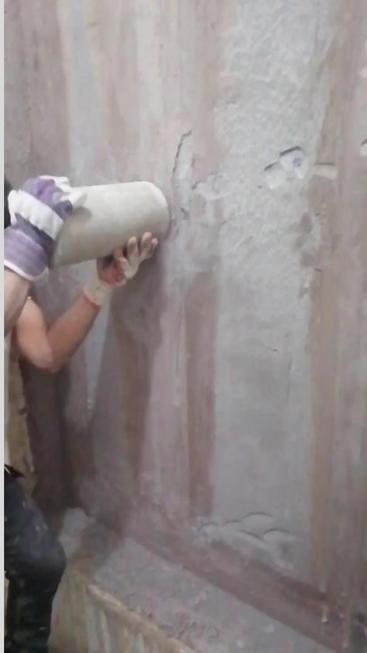
Muro de alta resistencia