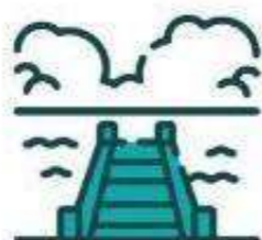
Lago con muelle y kiosco