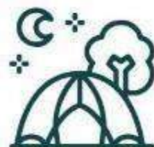
Zona de camping