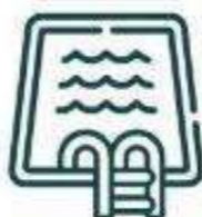
Piscina de adultos y niños