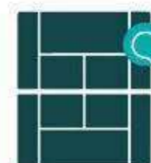
Cancha de tennis