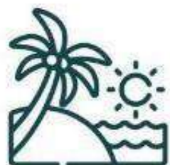
Club de playa