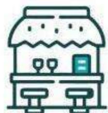
Restaurante - Bar