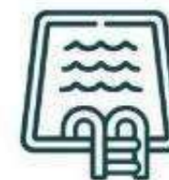
Piscina de lodos