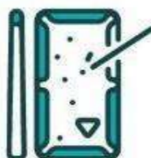
Salón de juegos